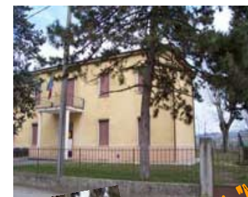
S. dell'Infanzia "Marzeno"