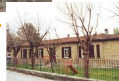
S. dell'Infanzia "S. Martino"