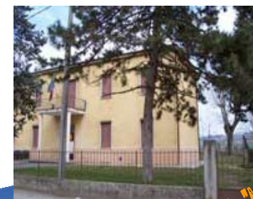
S. dell'Infanzia "Marzeno"