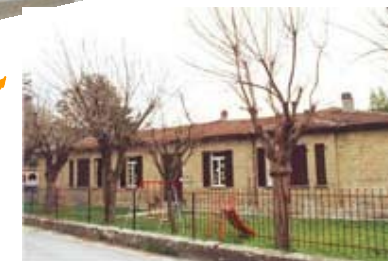
S. dell'Infanzia "S. Martino"