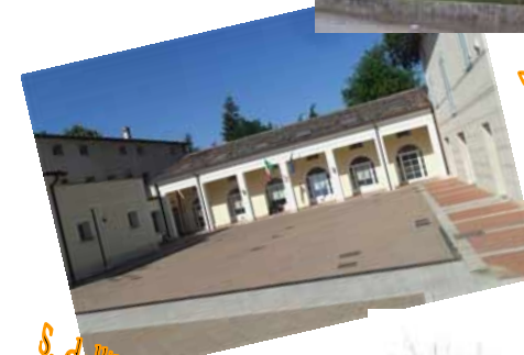
S. dell'Infanzia "Cicognani"